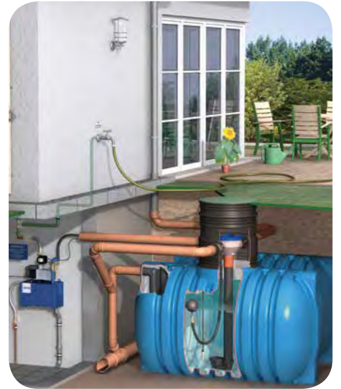
Abb. zeigt Behälterserie AQUA'TERNE 112