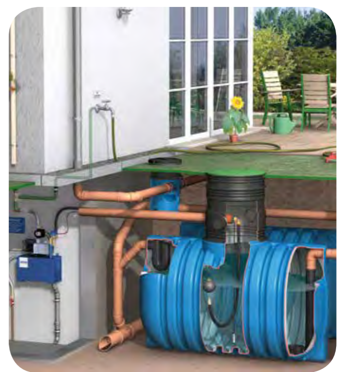
Abb. zeigt Behälterserie AQUA'TERNE 112