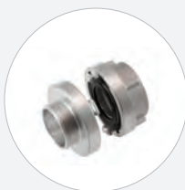
KUPPLUNGSSYSTEM STORZ C