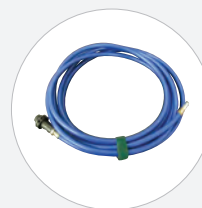
FÜLLSCHLAUCH FÜR AUFBLASBAREN RING (MIT KOMPRESSOR- ANSCHLUSS)